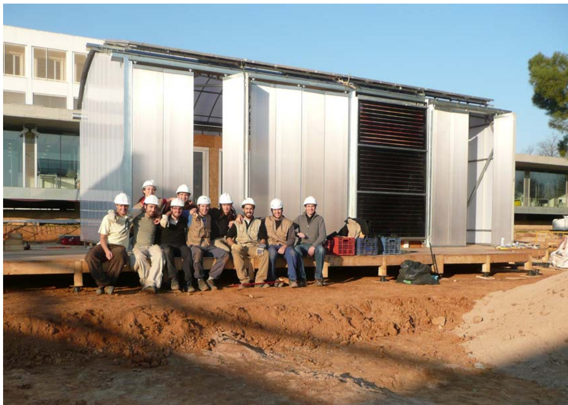
Imagen del mes:

Final de la segunda fase de montaje de LOW3 en el Campus Sant Cugat